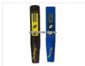
笔式pH/ORP测定仪- PH52 品牌: 米克Milwaukee 价格: 843 pH52分辨: 0.1 pH