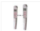
迷你型 EC/TDS/Temp 测试仪- EC59 品牌: 米克Milwaukee 价格: 1153 EC59 同时显示 EC (3999 \mu S/cm) 或TDS (2000 ppm) 值在屏幕上