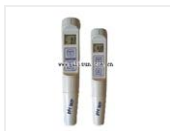
笔式 PH/ORP/Temp 测试仪- PH58 品牌: 米克Milwaukee 价格: 1970 测量范围: pH;-2.00 to 16.00,ORP; \pm 1000 mV,温度;-5.0 to 60.0 ^{\circ} C / 23.0 to 140.0 ^{\circ} F