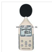
声级计- AR-814 品牌: 希玛 价格: 740 测量范围: A加权30~130dB C加权35~130dB 测量精确度: \pm 1.5 dB