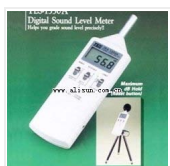
噪音计- TES-1350A 品牌: 泰仕 价格: 1000 分辨率: 0.1dB 准确度: \pm 2 dB