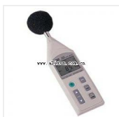
噪音计- TES-1352H 品牌: 泰仕 价格: 4400 量程: 30dB-130dB 准确度: \pm 1.4 dB