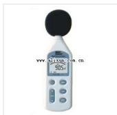
声级计- AR-824 品牌: 希玛 价格: 700 测量范围: A加权30~130dB C加权35~130dB 测量精确度: \pm 1.5 dB