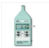
声级计- SL-4001 品牌: 路昌 价格: 1900 频率: 31.5~8000Hz 测量范围: 35~130 dB, 分辨率0.1dB