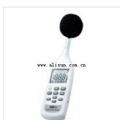
噪音计- TES-52A 品牌: 泰仕 价格: 2400 分辨率: 0.1dB ; 动态范围: 60dB 测量范围: 26 到 130 dB