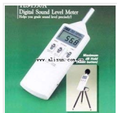
声级计- TES-1350R 品牌: 泰仕 价格: 2000 分辨率: 0.1dB 音量量程: 35-130dB