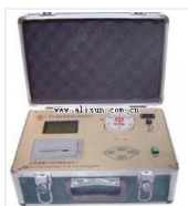
土壤养分速测仪- TFC智能普及型 品牌: 北京 价格: 5800 稳定性: A值(吸光度) 三分钟内飘移小于0.003 重复性: A值(吸光度) 小于0.005