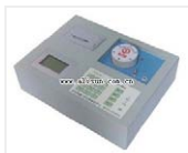
土肥测试仪- TFC-PF 品牌: 北京 价格: 12600 重复性: A值小于0.005 线性误差: 小于3.0%