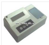
土壤养分速测仪- YN-1100 品牌: 河南 价格: 0 分辨率 : 0.001-9999 功率 : ≤5W