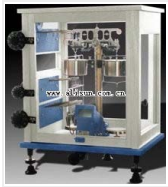
光学分析天平- TG328A/S 品牌: 上海 价格: 1670 称量范围: 0~200g 分度值: 0.1mg