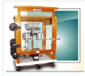
光学分析天平- TG328B 品牌: 上海 价格: 1500 称量范围: 200g 分度值: 0.1mg