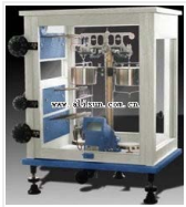
精密微量天平- TG335 品牌: 上海 价格: 29800 称量范围: 0~2g 分度值: 0.001mg