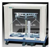
链条天平- TL-1B 品牌: 上海 价格: 3160 称量范围: 1000g 分度值: 10mg