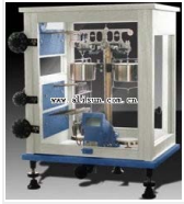
双盘分析天平- TG628A 品牌: 上海 价格: 780 称量范围: 0~200g 分度值: 1mg