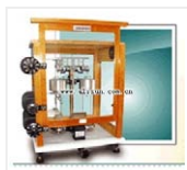
双盘分析天平- TG628A 品牌: 上海 价格: 780 称量范围: 200g 分度值: 1mg