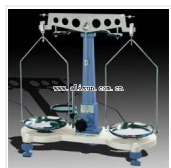
物理天平- TW-02B 品牌: 上海 价格: 640 称量范围: 0~200g 分度值: 20mg