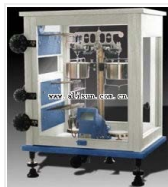
双盘分析天平- TG928C 品牌: 上海 价格: 0