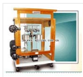
光学分析天平- TG328A 品牌: 上海 价格: 1670 称量范围: 0~200g 分度值: 0.1mg