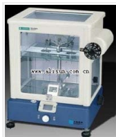
双盘机械天平- TG320B 品牌: 上海 价格: 39800