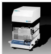
单盘分析天平- TG729C 品牌: 上海 价格: 2780