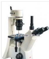
倒置生物显微镜- 37XB 品牌: 上海 价格: 11400 总放大倍数: 40X-400X 可配置摄像装置、摄影装置