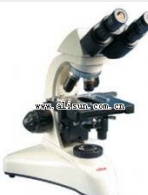
双目生物显微镜- BM-7 品牌: 上海 价格: 2950