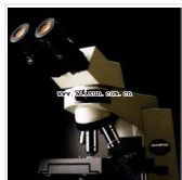
生物显微镜-CX41-12C02 品牌: 日本OLYMPUS 价格: 29900 双目,平场物镜