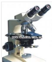
多用途生物显微镜- 44XI 品牌: 上海 价格: 7830 放大倍数: 25X-1600X 目镜: 平场目镜: 10X、16X