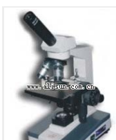
生物显微镜- XSP-5C 品牌: 上海 价格: 1480 单目,三个物镜 放大倍数: 100X-1600X