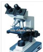
生物显微镜- XSP-6C 品牌: 上海 价格: 2600 双目,四个物镜 放大倍数: 40X-1600X\ -1600X