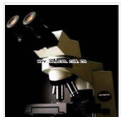
生物显微镜-CX41-32C02 品牌: 日本OLYMPUS 价格: 32900 三目, 平场物镜, 可增配照像接口, 摄象接口