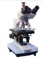
三目生物显微镜- BM-9 品牌: 上海 价格: 3425