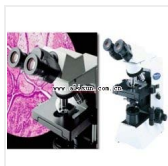
生物显微镜-CX31-32C02 品牌: 日本OLYMPUS 价格: 21900 三目,平场物镜,可增配照像接口,摄象接口