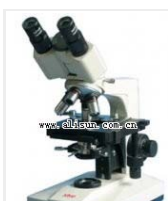
生物显微镜- XSP-4C 品牌: 上海 价格: 3100 观察头: 双目 放大倍数: 40X-1600X