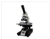
生物显微镜-XSP-BM-1C 品牌: 上光 价格: 1300 单目4个物镜, 1600倍, 电光源