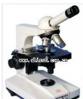
生物显微镜- XSP-3CD 品牌: 上海 价格: 2200 观察头: 单目 放大倍数: 40X-1600X