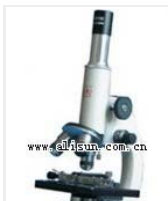
生物显微镜(学生型)-XSD-9 品牌: 上海 价格: 880 放大倍数: 50 \times -1600 \times 目镜: 5 \times 、10 \times 、16 \times