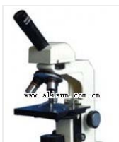
学生显微镜-PXP 品牌: 上海 价格: 1030 总放大倍数: 40X-400X