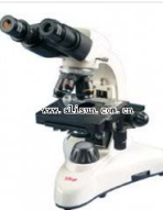
双目生物显微镜- BM-7A 品牌: 上海 价格: 2650