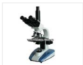
生物显微镜-XSP-BM-2CEA 品牌: 上光 价格: 2100 三目4个物镜, 1600倍, 电光源