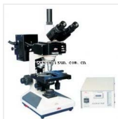
目落射荧光显微镜-BM-13C 品牌: 上海 价格: 15300 观察头: 三目 荧光装置: B(蓝光激发): 波长450~490nm