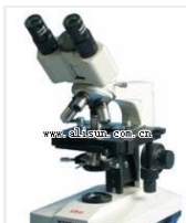
生物显微镜- XSP-2C 品牌: 上海 价格: 2850 观察头: 双目 放大倍数: 40X-1600X