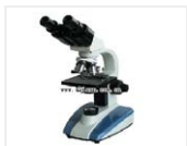
生物显微镜-XSP-BM-2CE 品牌: 上光 价格: 1780 双目4个物镜, 1600倍, 电光源