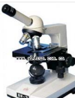
单目生物显微镜- BM-2 品牌: 上海 价格: 1950

放大倍数: 50X-1600X (双目) 目镜: 10X\12.5X\16X(单目)