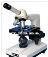
单目生物显微镜- BM-4 品牌: 上海 价格: 2200 放大倍数: 40X-1600X (单目) 目镜: 10X、12.5X、16X(单目)