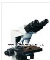
生物显微镜- XSP-8C 品牌: 上海 价格: 3180 放大倍数: 40X-1600X 目镜: 10X、16X