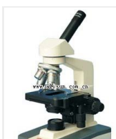
生物显微镜- XSP-3CA 品牌: 上海 价格: 1680 观察头: 单目,四个物镜 放大倍数: 40X-1600X