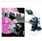
生物显微镜-CX31-12C04 品牌: 日本OLYMPUS 价格: 20000 双目,平场物镜