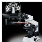
双目生物显微镜-CX21-BIM 品牌: 日本OLYMPUS 价格: 10400 4个物镜,1000倍