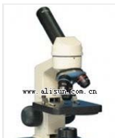
学生显微镜-SM2L 品牌: 上海 价格: 380 放大倍数: 50 \times -400 \times