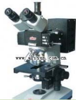
三目落射荧光显微镜- BM-13 品牌: 上海 价格: 15200