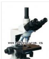
生物显微镜- XSP-8CA 品牌: 上海 价格: 3250 放大倍数: 40X-1600X 目镜: 10X、16X