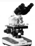
双目生物显微镜- BM-8 品牌: 上海 价格: 3800