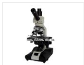
生物显微镜-XSP-BM-1CA 品牌: 上光 价格: 1580 V型镜筒, 放大倍数: 1600倍, 电光源