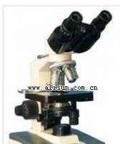
生物显微镜- XSP-2CA 品牌: 上海 价格: 2250 观察头: 双目 放大倍数: 40X-1600X