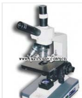
生物显微镜- XSP-5CA 品牌: 上海 价格: 2180 Y型,三个物镜 放大倍数: 100X-1600X