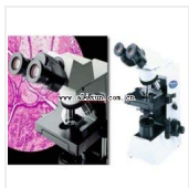
生物显微镜-CX31-72C02 品牌: 日本OLYMPUS 价格: 25300 双目, 观察筒倾斜式可调, 平场物镜