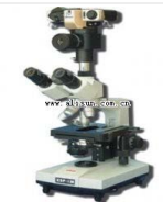
三目生物摄影显微镜- BM-10 品牌: 上海 价格: 7200