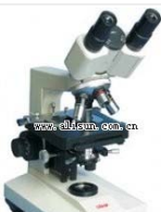
双目生物显微镜- BM-6 品牌: 上海 价格: 2850

放大倍数: 50X-1600X (双目) 目镜: 10X\12.5X\16X(单目)