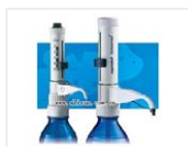
varispenser 瓶口分液器-2-10ml (496100035) 品牌: 艾本德Eppendorf 价格: 3629 2-10ml