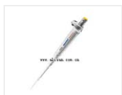
固定量程移液器- 200µl (4900000508) 200µl