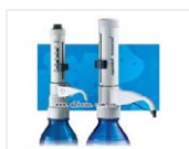
varispenser plus 瓶口分液器-20-100ml (496100060) 品牌: 艾本德Eppendorf 价格: 6634 20-100ml