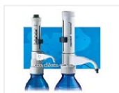
varispenser plus 瓶口分液器-10-50ml (496100051) 品牌: 艾本德Eppendorf 价格: 5150 10-50ml