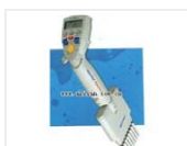
8道电动移液器-5-100ul(4860000330) 品牌: 艾本德Eppendorf 价格: 12288 5-100 \mu l