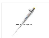
固定量程移液器- 10µl (4900000109) 10µl