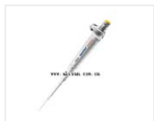
固定量程移液器- 20µl (4900000117) 20µl