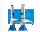
varispenser 瓶口分液器-1-5ml (496100027) 品牌: 艾本德Eppendorf 价格: 3629 1-5ml