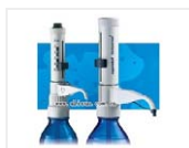
varispenser 瓶口分液器-5-25ml (496100043) 品牌: 艾本德Eppendorf 价格: 4820 5-25ml