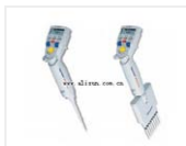
电动移液器- 5-100ul(486000070) 品牌: 艾本德Eppendorf 价格: 7200 5-100ul