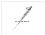
固定量程移液器- 250µl (4900000540) 250µl