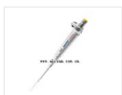
固定量程移液器- 1500µl (4900000923) 1500µl