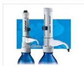
varispenser 瓶口分液器-0.5-2.5ml (496100012) 品牌: 艾本德Eppendorf 价格: 4260 0.5-2.5ml