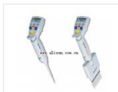
电动移液器- 0.5-10ul(486000062) 品牌: 艾本德Eppendorf 价格: 7200 0.5-10ul