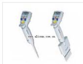
电动移液器- 50-1000ul(486000097) 品牌: 艾本德Eppendorf 价格: 7200 50-1000 \mu l