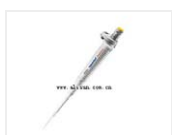
固定量程移液器- 1000µl (4900000524) 1000µl