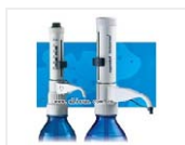
Varispenser 瓶口分液器-20-100ml (496100063) 品牌: 艾本德Eppendorf 价格: 7920 20-100ml