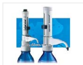
Varispenser 瓶口分液器-10-50ml (496100055) 品牌: 艾本德Eppendorf 价格: 7920 10-50ml