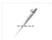
固定量程移液器 Reference®-2000µl (4900000907) 2000µl