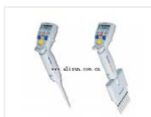
电动移液器- 100-5000ul(486000100) 品牌: 艾本德Eppendorf 价格: 7200 100-5000 \mu l