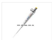
固定量程移液器- 100µl (4900000133) 100µl