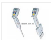
电动移液器- 20-300ul(486000089) 品牌: 艾本德Eppendorf 价格: 7200 20-300 \mu l