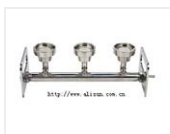
过滤座-BV300 品牌: 美国Sciencetool圣斯特 价格: 20350 使用滤杯: 100ml、300ml、500ml