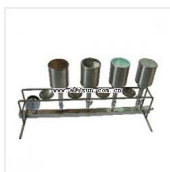
细菌过滤器-XC-4 品牌: 杭州汇尔 价格: 2980 4孔, 附燃烧架, 送水射器