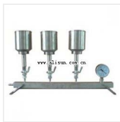
细菌过滤器-XC-3 品牌: 杭州汇尔 价格: 2580 3孔, 附燃烧架, 送水射器