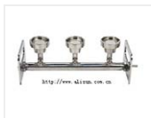
过滤座-BV320 品牌: 美国Sciencetool圣斯特 价格: 20350 材质: 不锈钢SS#316 使用漏斗: 多种