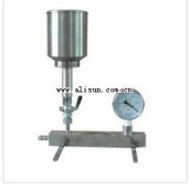
细菌过滤器- XC-1 品牌: 杭州汇尔 价格: 1880 1孔,送水射器