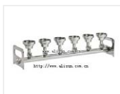
过滤座-BV610 品牌: 美国Sciencetool圣斯特 价格: 41230 使用滤杯: 100ml