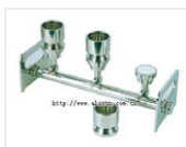
过滤座-BV310 品牌: 美国Sciencetool圣斯特 价格: 21147 使用滤杯: 100ml