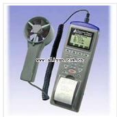
列表式风速风量计-AZ-9871 品牌: 衡欣 价格: 2500

风速: 0.4~30m/s分辨率:0.01m/s 温度: -10~60 C分辨率:0.1 C