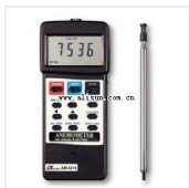
热线式风速风量计-AM-4214 品牌: 路昌 价格: 3200

温度范围: AVM-03 only 解析度: 0 - 60.0 ( C ); 32.0 - 140.0 ( F )