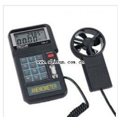
风速计-AVM07 品牌: PROVA 价格: 2150

温度测量: -20~60 C (-4~140 F) 准确度: \pm 0.6 C (1 F) ; 解析度: 0.1 C (0.1 F)