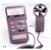
风速计-AVM01 品牌: PROVA 价格: 1320

风速测量范围: 0.3-45m/s 风速测量误差: \pm 3\% \pm 0.1 dgts