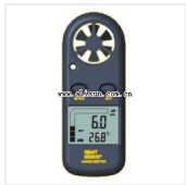
数字风速计-AR-816 品牌: 希玛 价格: 390