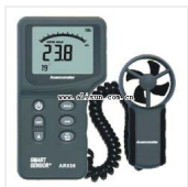
数字风速计-AR-826 品牌: 希玛 价格: 740

风速m/s, ft/min, knots, Km/hr, mph 瞬间/平均/2/3最大风量测量