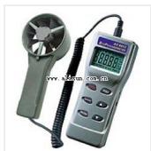
多功能风速仪-AZ-8912 品牌: 衡欣 价格: 1500

测量范围: 温度: -20 C~60 C (-4 F~144 F); 相对湿度: 0 ~ 100% 湿球温度: -22 C~ 70 C; 风速: 0.3~35 m/s