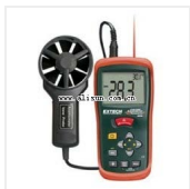
叶轮风速仪-AN200 品牌: 美国艾示科EXTECH 价格: 2000

风速: 0.4~30m/s分辨率:0.01m/s 温度: -10~60 C分辨率:0.1 C